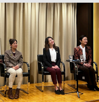
国際女性デーのイベントに パネリストとして登壇しました

日本の言論の自由を脅かす他国からの日本への主権侵害 に関し、国会で質問。その内容がアベプラ、産経新聞にて 取り上げられました。 強制労働で製造されたアルミを日本の企業が使用してい る可能性がある件について、政府に調査を要求しました。 その取り組みが、産経新聞に取り上げられました。 対中列国議連でドイツの総合化学会社BASFのCEOと対談 し、ウイグル事業からの撤退をお約束いただいたことが、 The Guardian(英)に取り上げられました。