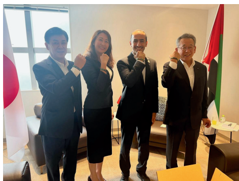
JAいちかわとUAE大使館を訪問し、 地元の農産品の輸出を促進