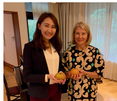
フィンランド大使と 女性の働き方について意見交換