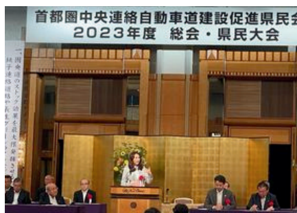
地元の声を受け、 道路整備を前に進めます！