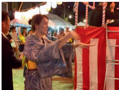
地域の夏祭りでは 浴衣に着替えて盆踊り