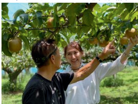
地元の産業を応援します！